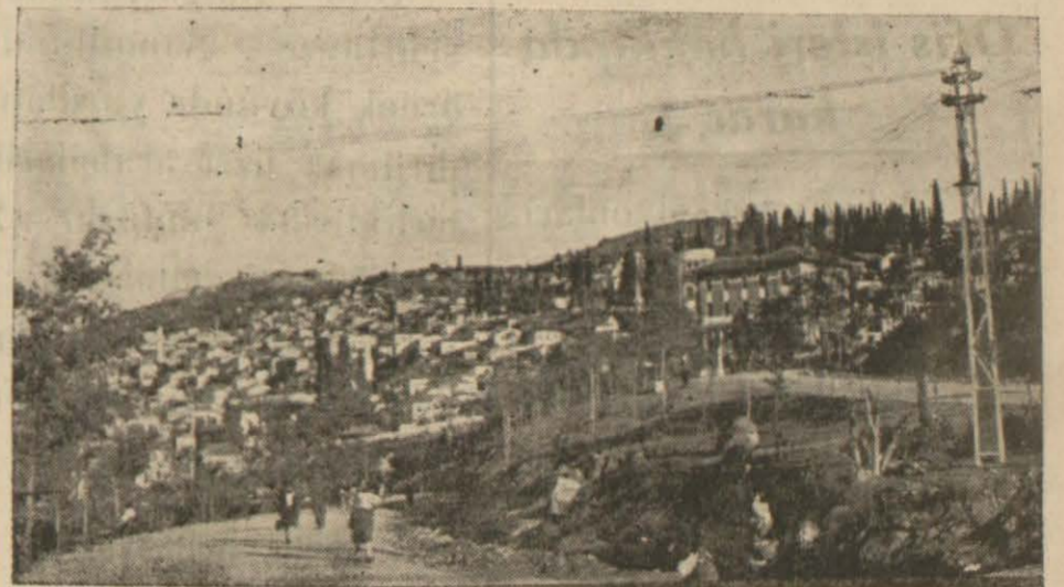
Güzel izmirden bir görünüş

sefe vesosyoloji dersleri içinde bir kaç bahis halinde okutulacaktır. Yeni müfredat programlarında Fransa liselerinde 12 ve Alman liselerinde 13 ders yılında okutulan derslerin 11 ders senesine sığdırılması göz önünde tutulmuştur.